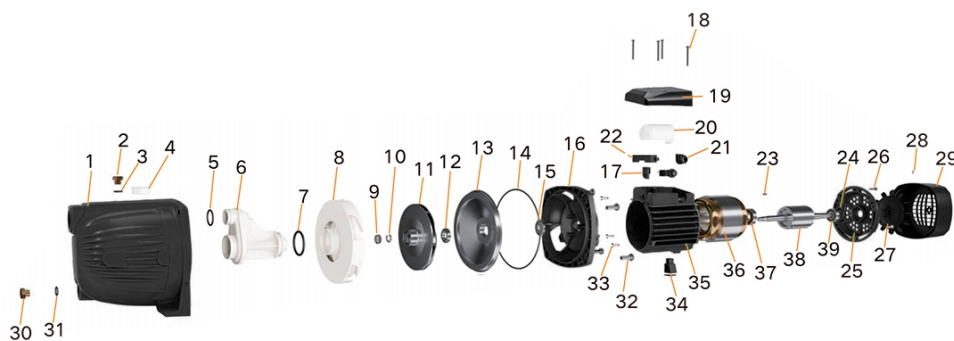
Gráfico de estructura