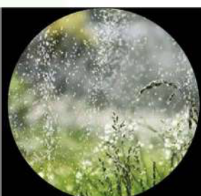
Riego de jardines