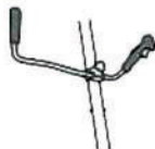
Mango plegable para fácil almacenamiento