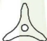
Hoja de 3 puntas