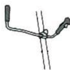
Mango plegable para fácil almacenamiento