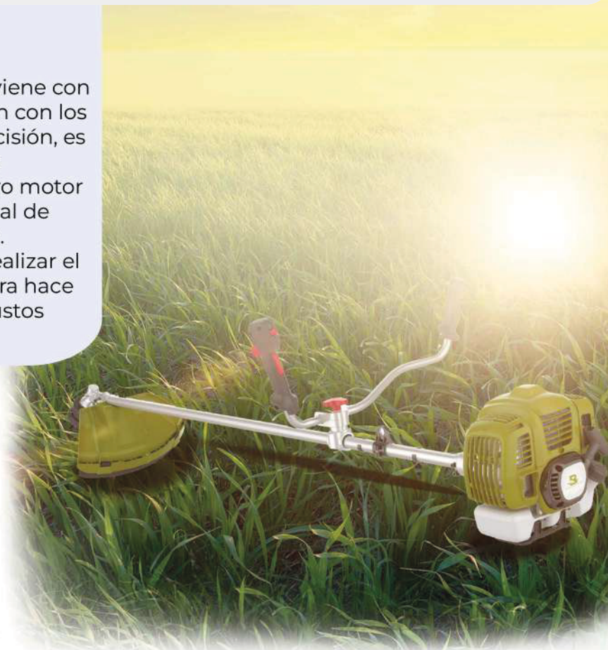
Cortador de caña de azúcar