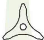
Hoja de 3 puntas