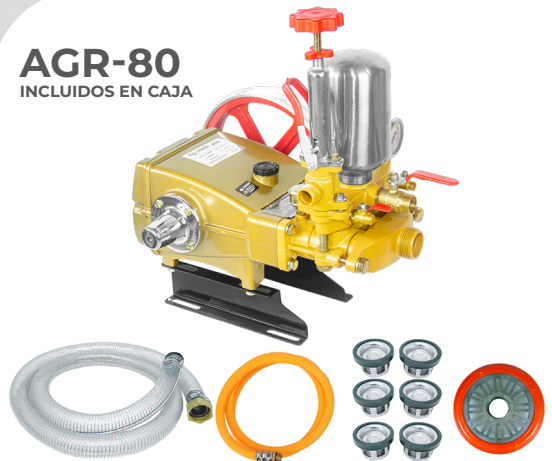
AGR-80 INCLUIDOS EN CAJA

USOS: COMO BOMBA DE ACOPLE PARA HIDROLAVADORAS, PARA SISTEMAS DE CAR WASH. PARA TRABAJOS DE IRRIGACIÓN EN CAMPOS DE CULTIVO.